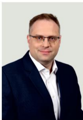
Györfi Mihály polgármester